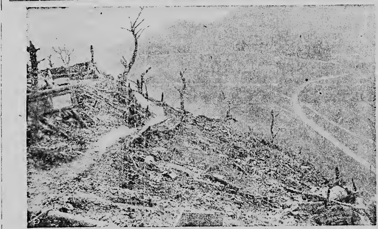
OP „SNIPER RIDGE“ hebben twee Amerikaanse soldaten hun nikkelpost betrokken. Dit punt is zwaar omstreden, zoals men duidelijk op de foto kan zien. De militairen hebben een goed uitzicht op de Driehoeksheuvel, althans bij helder weer. Van die zijde kan elk ogenblik de vijand weer worden verwacht.

Na afloop van deze feestelijkheden werden de patrouillechokken bekeken. Zoals bekend heeft de Sint Franciscusgroep onlangs de beschikking gekregen over een hernieuwde blokket en thans waren er nieuwe patrouillechokken gemaakt. De jury had geen gemakkelijke taak want alle patrouilles hadden hun best gedaan. De uitslag luidde: 1. Chuchubi, 2. Tropical en 3. Parkieten. Aan Pater Fick, die vooral in de jeugdbeweging op ons eiland geen onbekende is, hartelijke gelukwensen en hopi anja di bida ma.